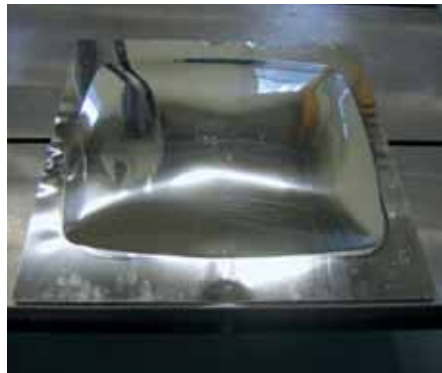
Kuva 4: JaloteräsStudion impulssimuovaimella tehty säiliön päätyaihio.