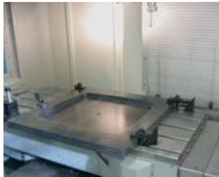
Kuva 3: Impulssimuovaimen tarvitsemat työkalut suunniteltiin ja koneistettiin Nivalan ELMESTudiossa.

Nivalan ELMESTudion osaamista hyödyntäen kehitettiin tuotteen konstruktioita, laserhitsausmenetelmää sekä koneistettujen puristintyökalujen valmistusta. Tornion JaloteräsStudion impulssimuovaimella (kuva 4) ja tandem-hitsauslaitteilla saatiin vertailevaa tietoa rinnakkaisista valmistusmenetelmistä. (kuva 5) Raahen Steelpolis oli mukana ruostumattoman teräsmateriaalin asiantuntijana.