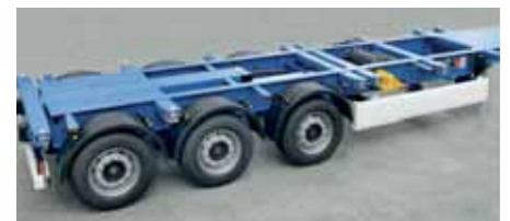
Erikoislujan, muovattavan 700-lujuusluokan teräksen käyttökohde.