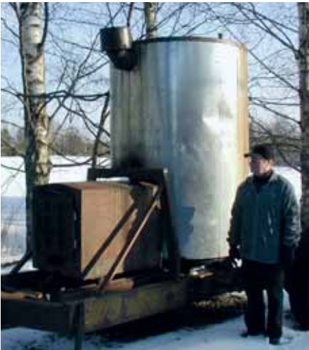
Puuhi-2 puun kuivatuslausretortti. Kuvasta puuttuvat piippu ja tuubilauhduttimet.