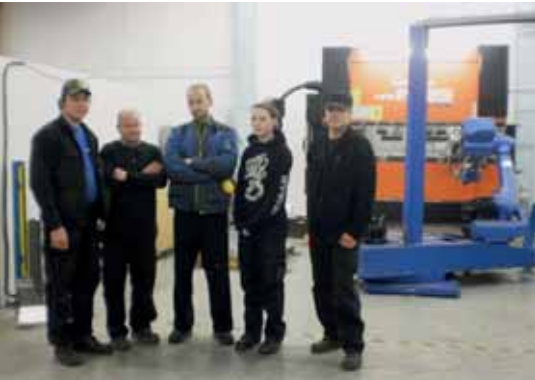
Kuva 1: Omek Automation Oy:n henkilökuntaa robotisoidun särmäyspuristimen edessä.

Omek Automation Oy on nivalalainen ohutlevymekaniikan alihankintaan erikoistunut metallialan yritys, joka alihankintatoiminnan ohella on pyrkinyt laajentamaan tuotantonsa myös omien ohutlevytuotteiden puolelle. Omek Automation aloitti toimintansa 2000-luvun alussa ja työllistää nykyisellään liki kymmenen henkeä. Yrityksen laitekanta on uusi ja nykyaikainen – sisältäen ohutlevytuotteiden mekaanisen valmistuksen tyypillisimmät työmenetelmät levytyökeskuksineen ja robotisoiduin särmäyspuristimineen. (kuva 1)