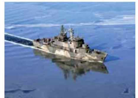
Miilux Oy, suojausterästen käyttökohde.

Teksti: Tapio Oikarinen ja Risto Ylikangas