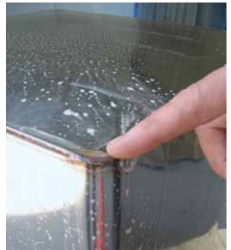
Kuva 6: Yhden säiliön koeponnistus suoritettiin paineilmalla.

Säiliön kehittelyn yhteydessä laserhitsaus todettiin menetelmänä erinomaiseksi; hitsauksen aiheuttamat muodonmuutokset kohteeseen ovat huomattavan vähäiset verrattuna perinteisiin menetelmiin. Varsinaista säiliön testausprosessia ei protosarjan aikana toteutettu, vaikkakin yksi laserilla hitsattu säiliö testattiin koeponnistamalla se paineilmalla ja hitsaussaumojen mahdolliset vuodot havaittiin voitelemalla hitsaussaumamat vesi-saippua –liuoksella. (kuva 6) Koeponnistuksen tulokset olivat pienten valmistusteknisten muutosten jälkeen tämän valmistusmenetelmän osalta rohkaisevia tässä kyseisessä tapauksessa.